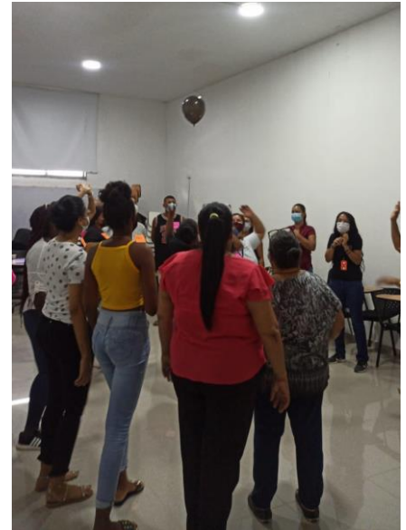
Imagen 3. Taller Entre-Lazos actividad estallar el globo.

“Dedos al rostro”: en parejas se ubica el dedo índice de un integrante a 15 centímetros de la nariz del otro. Entre ambos debe ser sostenida siempre esta distancia, el movimiento del cuerpo depende del señalado, y debe reconocerse los niveles del espacio mientras se juega.