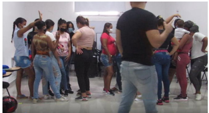
Imagen 6. Taller Entre-Lazos; Maquina humana.

“Maquina humana”: una por una, voluntarias se acercan al centro del escenario para representar los eslabones de una maquina con sus sonidos y movimientos. La máquina es una dinámica exigente, demanda de ritmo, atención, e improvisación. El objetivo final es sostener una máquina que exprese la naturaleza de la humanidad.