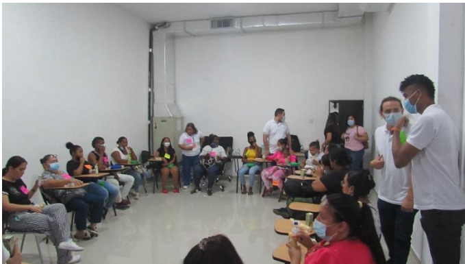
Imagen 7. Taller Entre-Lazos. Tiempo de Acción, despliegue vivencial. Elaboración propia.

Anécdota “Cómo personas siempre necesitamos del otro que nos brinde ayuda.”