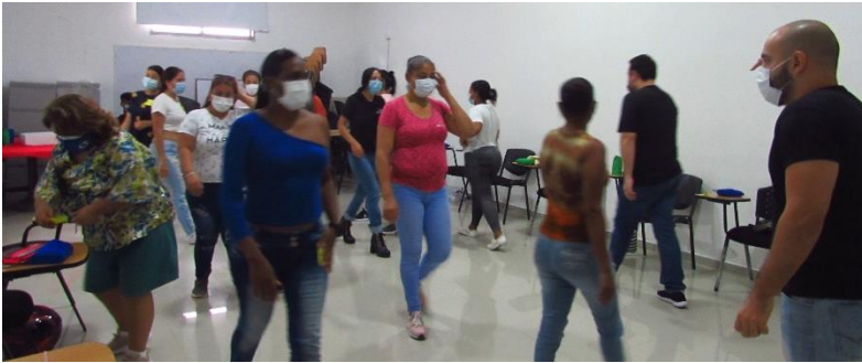
Imagen 5. Taller Entre-Lazos; calentamiento físico.

Anécdota 3 “Yo vine a este taller por un atraco, me sentía encadenada, y me dejaron en el aire.”