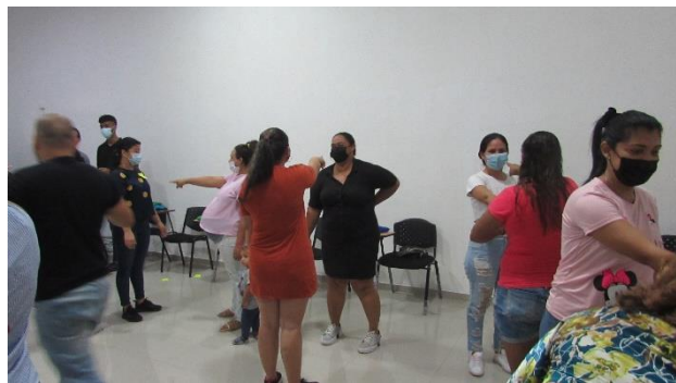
Imagen 4. Taller entre lazos; actividad flechas.

“El regalo”: En esta dinámica se evalúan las expresiones del cuerpo, expresiones propias y rápidas que no permitan la intelectualización.