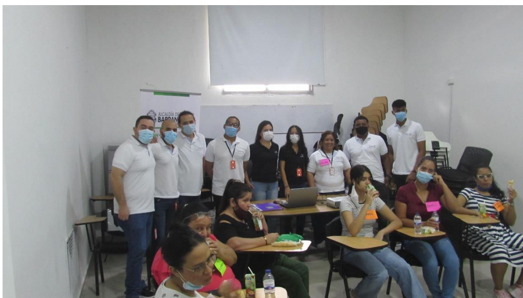
Imagen 9. Equipo psicosocial y de apoyo.