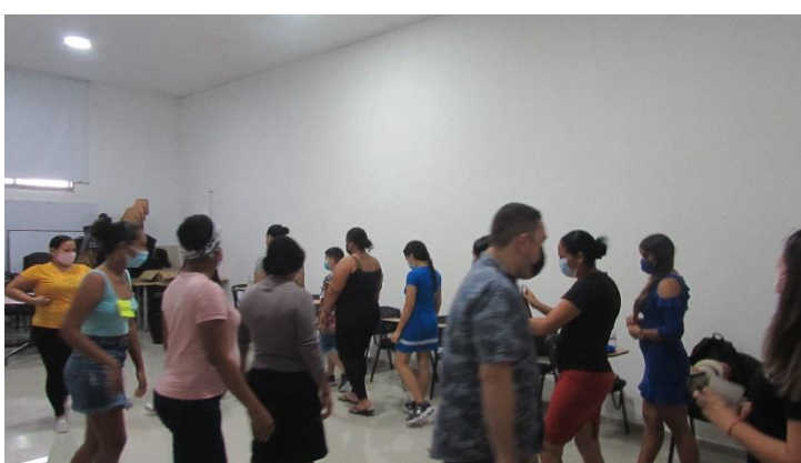
Imagen 1. Taller Entre-Lazos; Del espacio físico al mental. Fuente: Elaboración propia.

Con las técnicas corporales, de juegos, se generó una reapropiación del sentido de unidad entre el cuerpo, la experiencia espacial y el otro. A partir de acciones sensibles, con ritmos variables, empleando los espacios físicos y de alteridad, en un tiempo ajeno a lo cotidiano, con el uso de actos y escenas, las participantes entran en una relación de confianza consigo misma, con los otros y con el sentido del diario vivir. Calentar